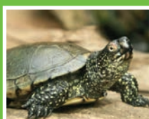
La tortue cistude