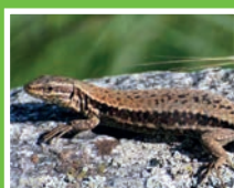
Le lézard des murailles