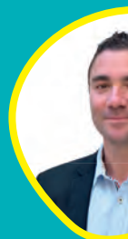
David G... Délégué à l' handicap et à