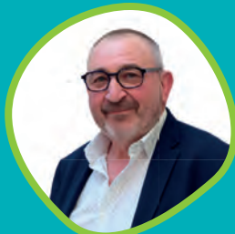
Patrick Leger Député aux quartiers ruraux et au monde agricole