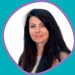
Dalia Moldovan Députée aux droits des femmes, à la lutte contre les discriminations, à la défense des valeurs de la République