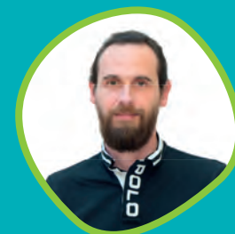
Xavier Loiseau Délégué à la transition écologique, à la biodiversité et aux mobilités douces