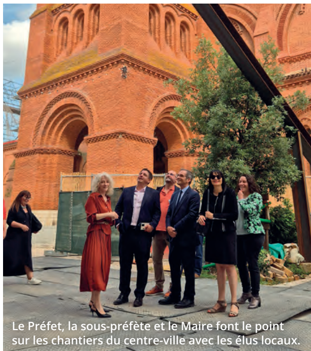
Le Préfet, la sous-préfète et le Maire font le point sur les chantiers du centre-ville avec les élus locaux.