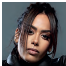
Figure majeure de la scène française, Amel Bent s'est imposée grâce à sa voix puissante et son authenticité. Révélée au grand public avec le titre Ma Philosophie , elle enchaîne depuis les succès et touche toutes les générations avec des chansons mêlant émotion, énergie et sincérité.

Concert gratuit : Amel Bent Mercredi 5 août, parc Saint-Cyr, 21h30