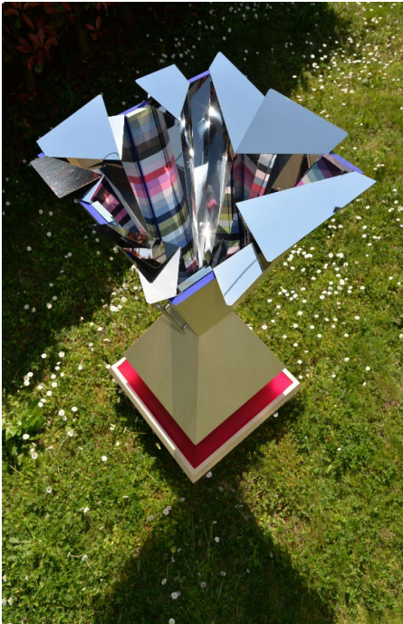
Monica Gorini. Kaléidoscope. Déconstructions chromatiques , 2024

Bois, LED, perspex, acier poli effet miroir, matériel électrique, palettes peintes avec émulsion vinylique, finition avec un vernis soft touch