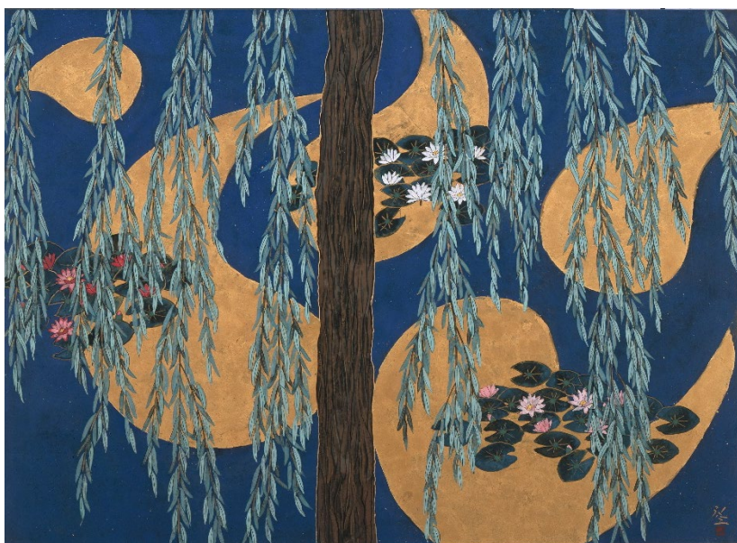
Hiramatsu Reiji. Reflets de nuages dorés , 2010. Pigments feuille d'or et colle sur papier, 65, 2 x 90, 9 cm Giverny, musée des impressionnistes, MDIG 2013.1.3