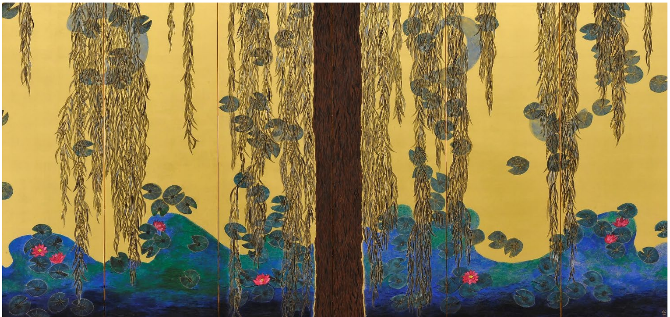
Hiramatsu Reiji. Giverny, l'étang de Monet ; brise légère 2013. Double paravent à six panneaux, pigments, feuille d'or et colle sur papier, 180 x 720 cm

Nos remerciements s'adressent également à l'équipe du musée de Gajac et aux agents du service Cadre de Vie – Espaces verts pour leur investissement sans faille dans la préparation de cette manifestation.